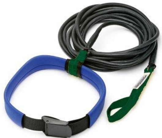
アシストチューブ